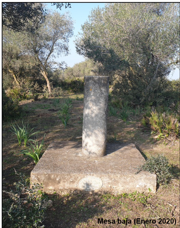
Mesa baja (Enero 2020)

Horizonte GPS: Parcialmente cubierto por materia vegetal.