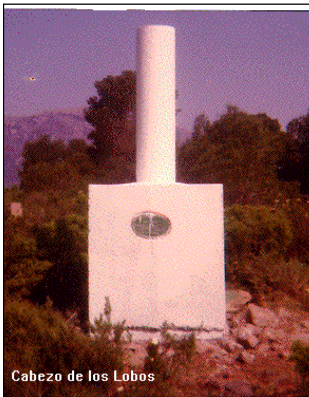
Cabezo de los Lobos