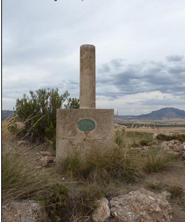
Las Caleras (jul-2014)