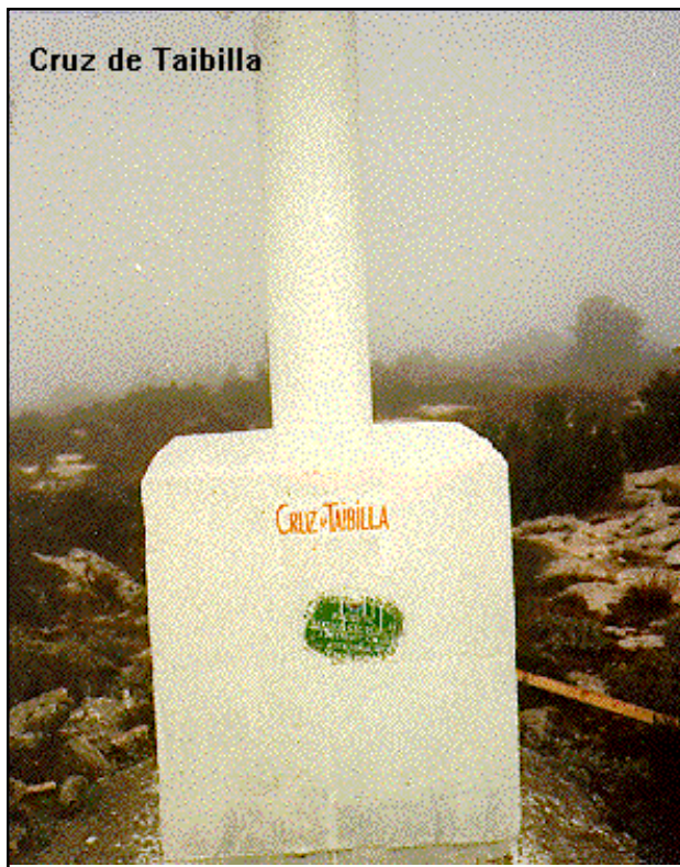
Cruz de Taibilla