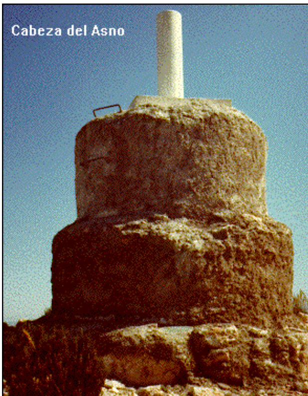
Cabeza del Asno