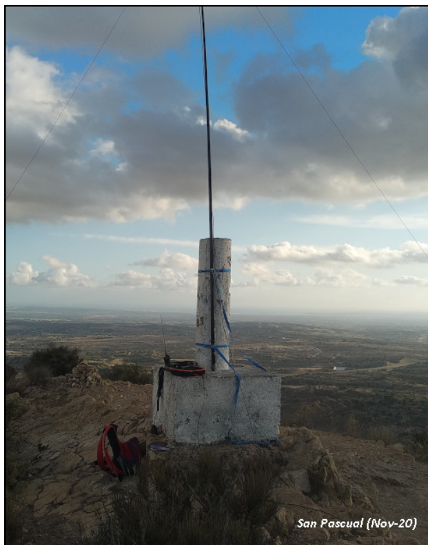
San Pascual (Nov-20)