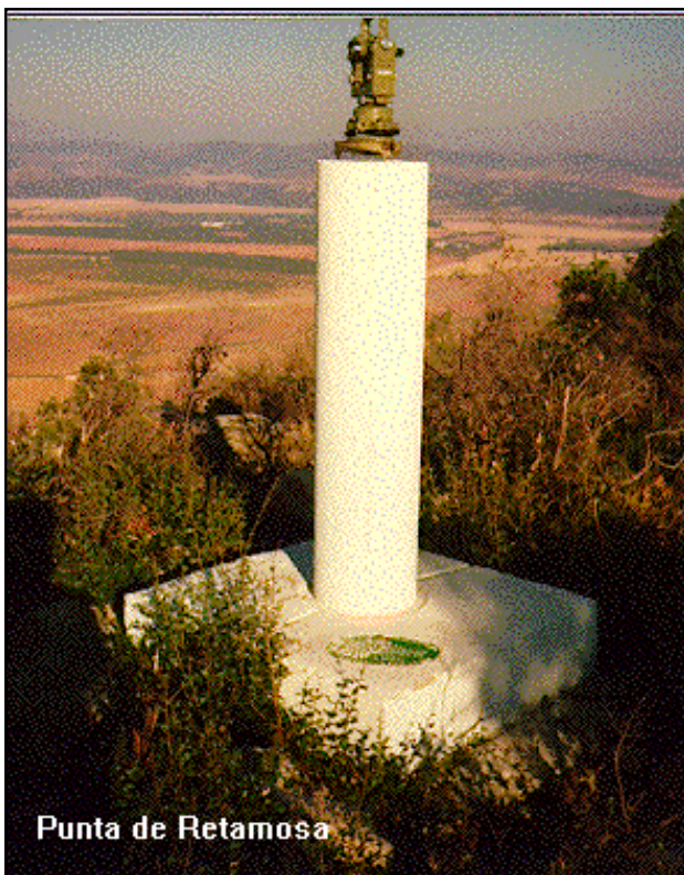
Punta de Retamosa