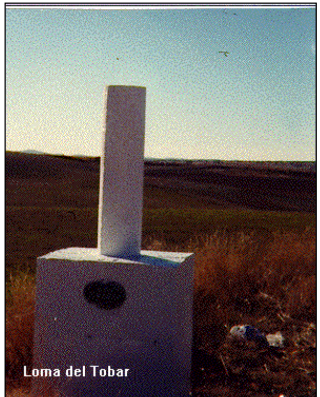
Loma del Tobar