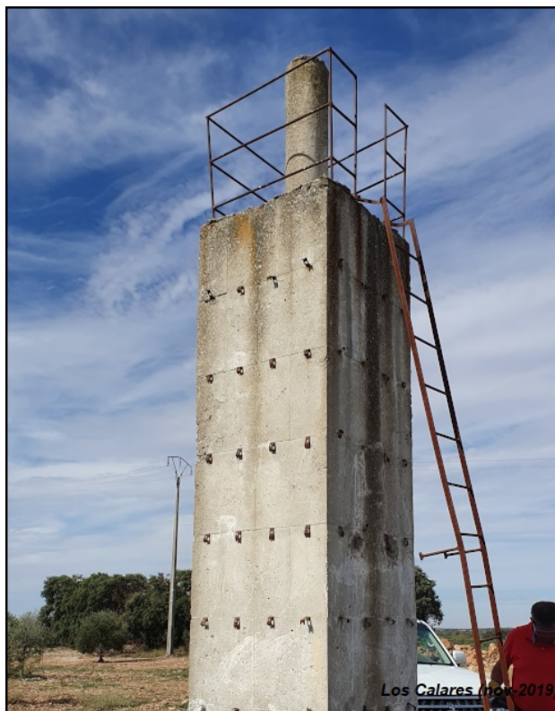
Los Calares (nov-2019)