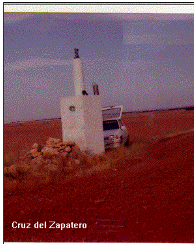
Cruz del Zapatero