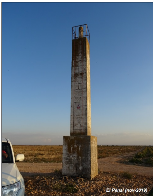
El Penal (nov-2019)