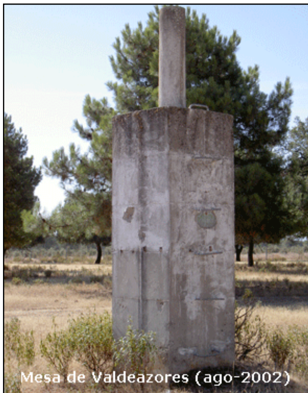
Mesa de Valdeazores (ago-2002)

Desde Guadalupe, se sale a la carretera C-401, se toma en dirección a Logrosán y en el Km. 134,5, está el collado de Martín Blasco, donde hay una bifurcación, se sigue por la carretera a Obando, se pasa el cruce con la carretera de Cañamero-Valdecaballeros y al llegar al Km. 62,5, hay un camino forestal que cruza la carretera, siguiendo a la izquierda. A los 50 m. se bifurca, se sigue a la derecha y se dejan dos ramales a la derecha a los 1.000 m. y 1.400 m. A los 2.500 m. se desemboca en otro camino, se tuerce a la derecha y a los 3 Km. se llega a la señal, que está a 100 m. a la derecha del camino.