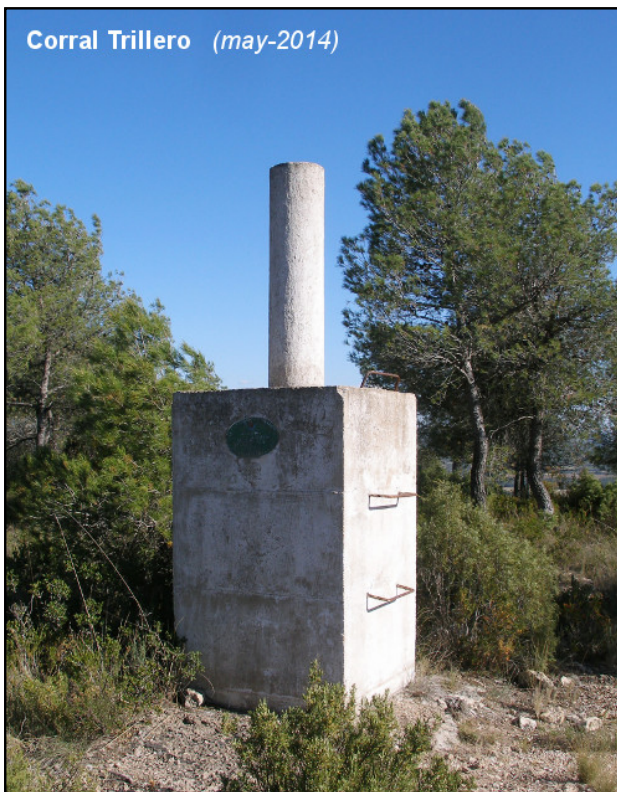
Corral Trillero (may-2014)

Parcialmente cubierto por materia vegetal.