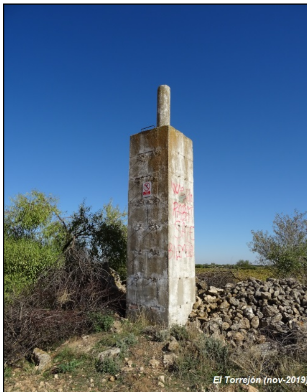
El Torrejón (nov-2019)