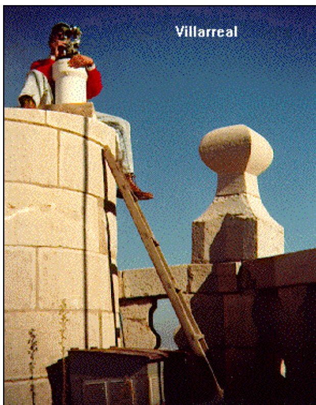
Planta del Compañero