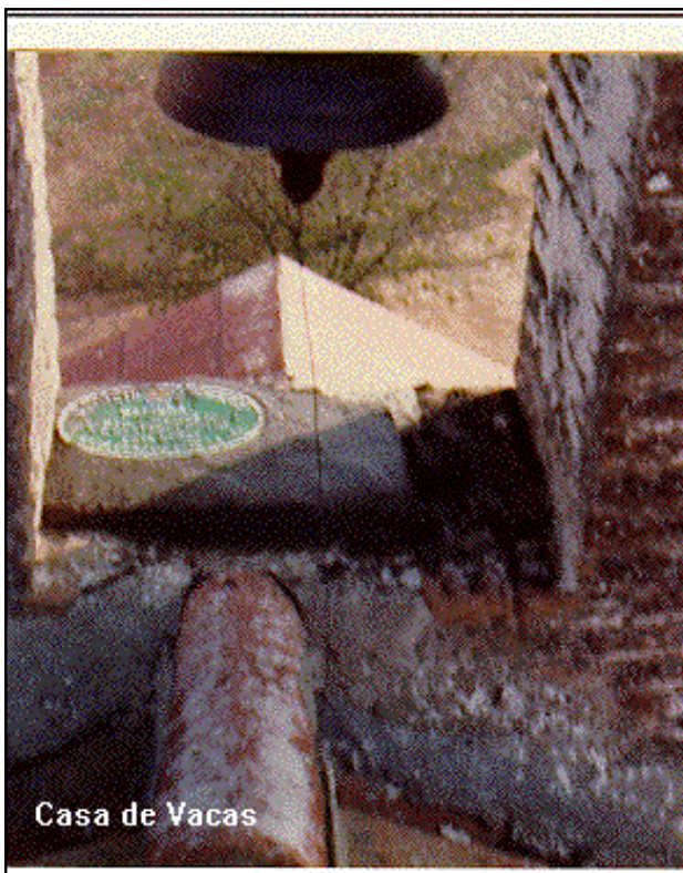
Casa de Vacas

Desde Malpica de Tajo, por la carretera a San Martín de Pusa hasta el Km. 9,200, entrando a la derecha por una pista con carteles en su entrada a "Casa de Vacas" y al cabo de 2,9 Km. se llega a la ermita.