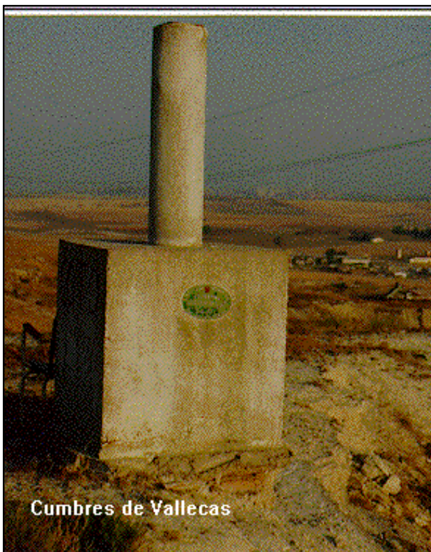
Cumbres de Vallecas

Desde Madrid, por la autovía A-III hacia Valencia, al llegar al Km. 14,200, se entra a la derecha por la carretera a la Fábrica de Yesos "La Paloma". Recorridos 800 m., se tuerce a la izquierda por el camino que sale de la intersección con otra carretera, se pasa por la Fábrica de Yesos "La Palentina" y se llega a la de "La Valenciana". Del vertedero de esta fábrica sale, hacia la derecha, un camino que lleva a la señal.