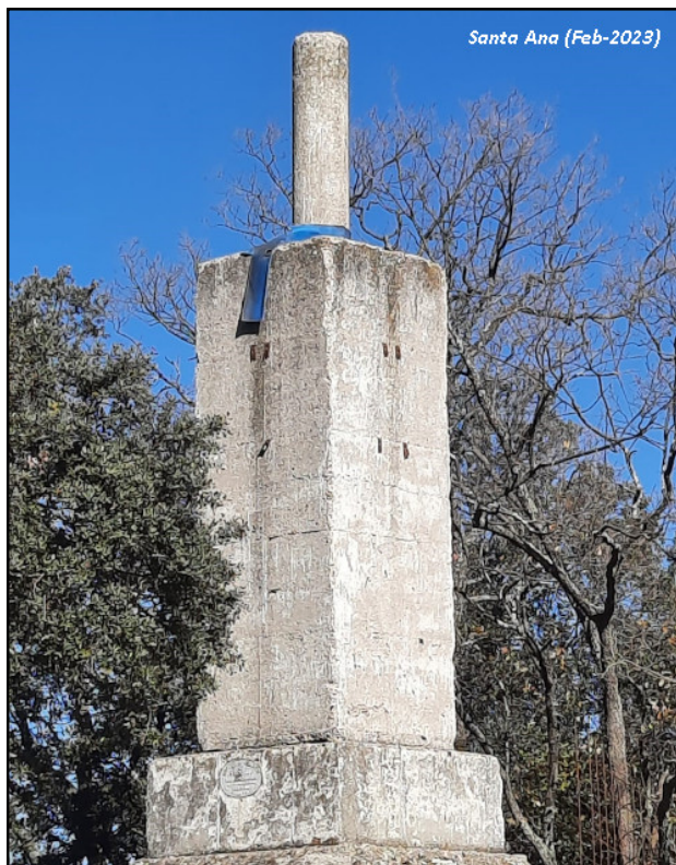
Santa Ana (Feb-2023)