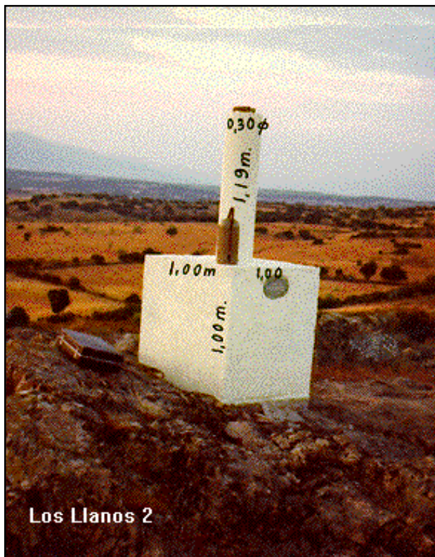
Los Llanos 2