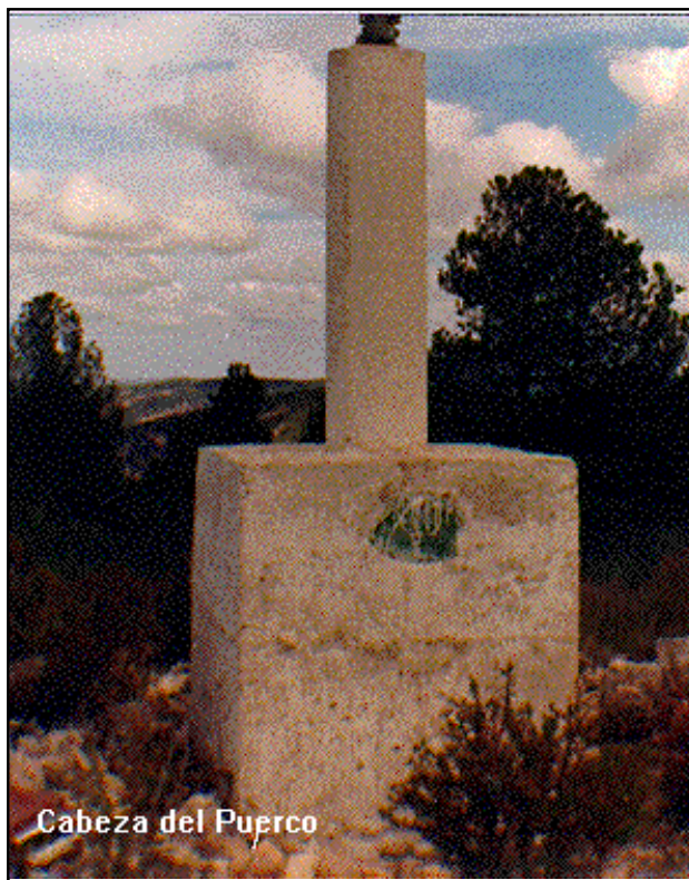
Cabeza del Puercó

Posible sombra de una antigua caseta de vigilancia de incendios.