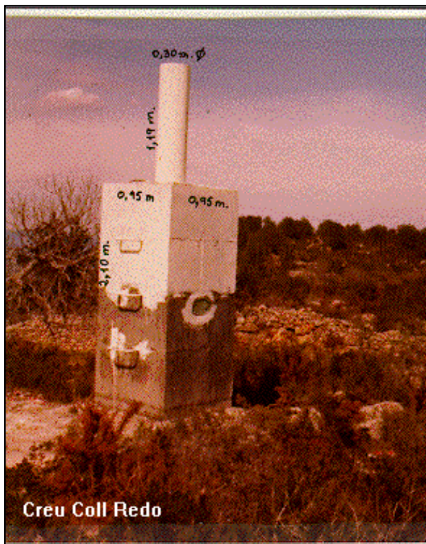
Creu Coll Redó