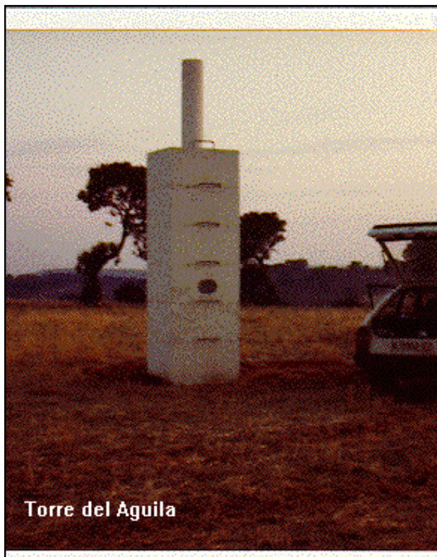
Torre del Águila