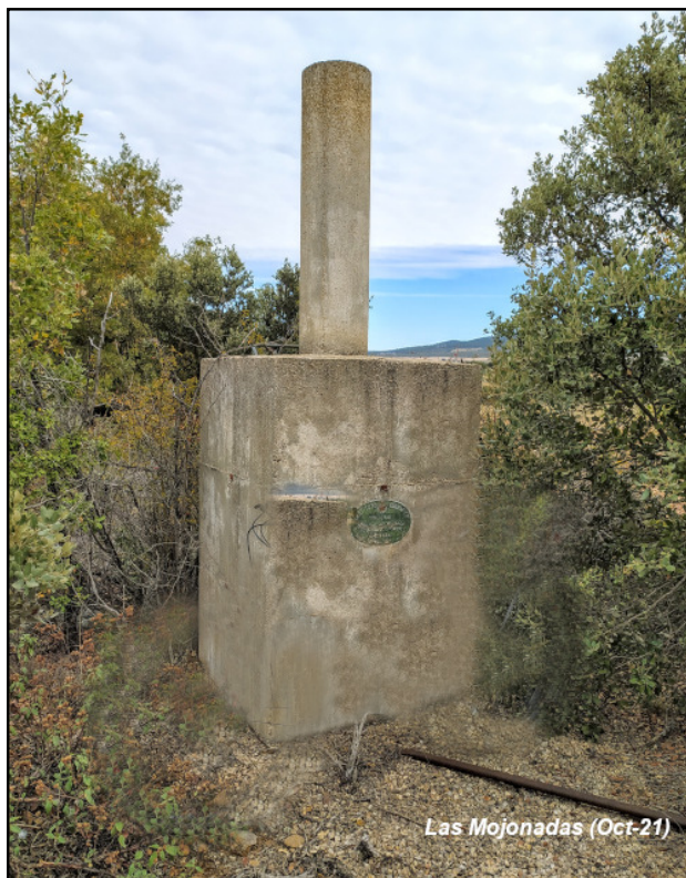
Las Mojonadas (Oct-21)