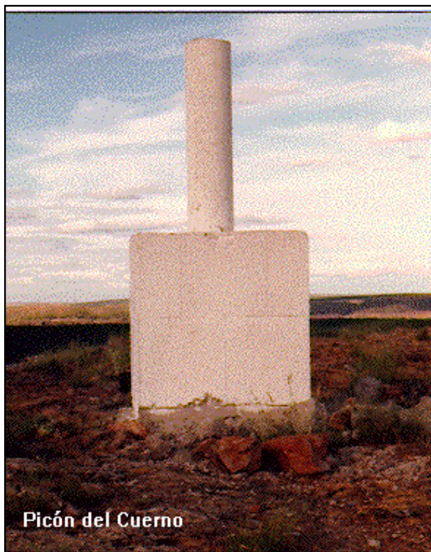
Picón del Cuerno