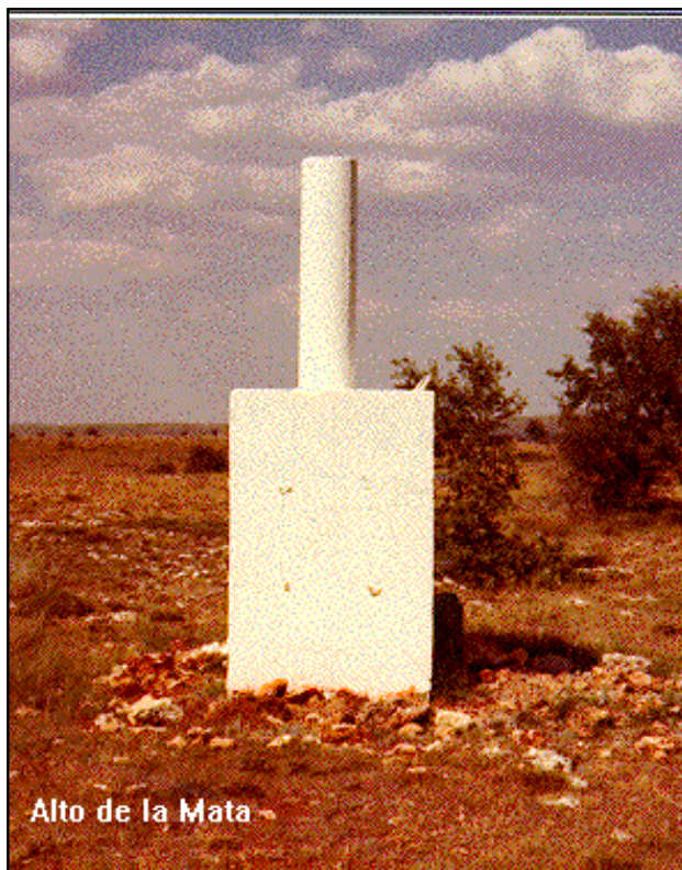
Alto de la Mata

Desde Maranchón, por la carretera N-211 en dirección a Guadalajara, recorridos 4,5 Km. se sigue a la derecha por la carretera a Medinaceli durante 2,7 Km. aproximadamente y, 40 m. después de pasar el cartel indicador de provincia de Soria, se entra a la izquierda por un camino por el que se sigue durante 1 Km., hasta que se acaba el camino. Se deja el vehículo y a pie, hacia la derecha, monte a través, pasando por el Alto de la Motilla, se llega a la señal recorriendo 1.200 m.