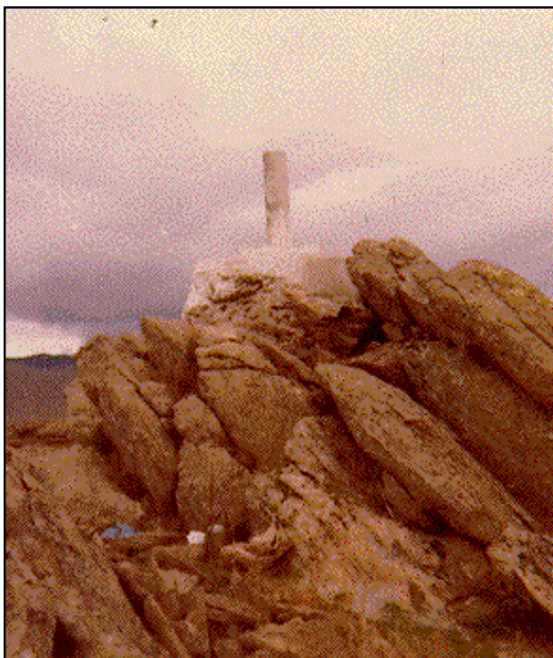
Pico de la Dehesilla