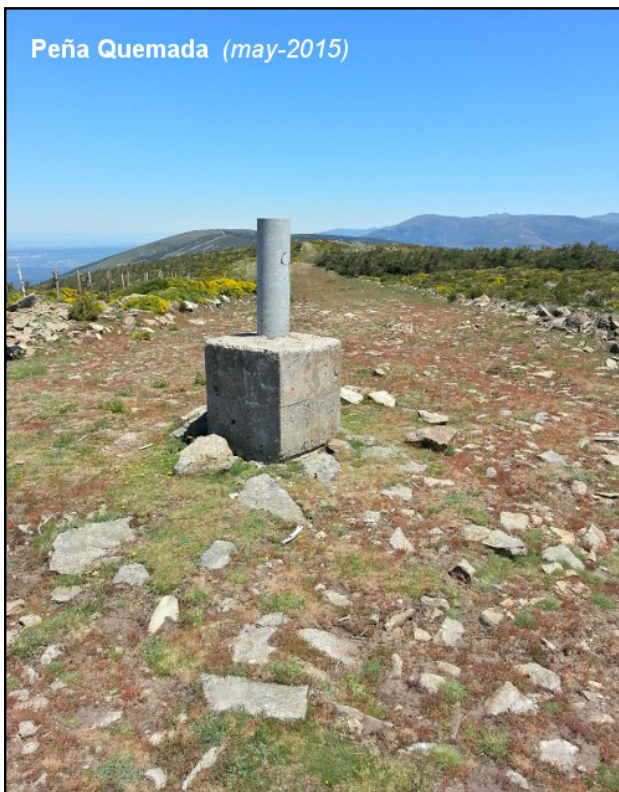
Peña Quemada (may-2015)