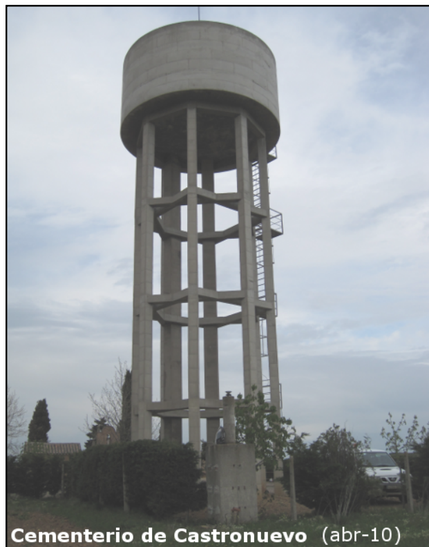
Cementerio de Castronuevo (abr-10)

La construcción de un nuevo depósito de Agua junto a la Señal obstaculiza parte del horizonte.