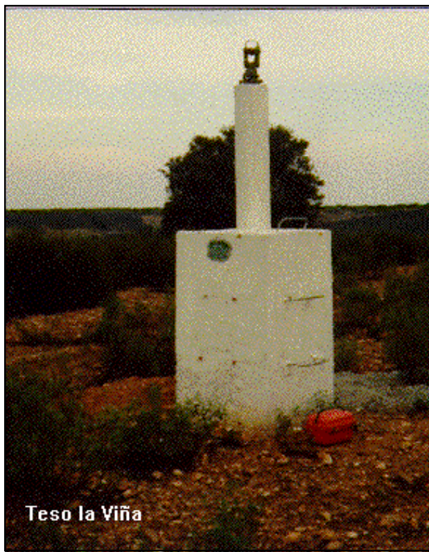
Teso la Viña