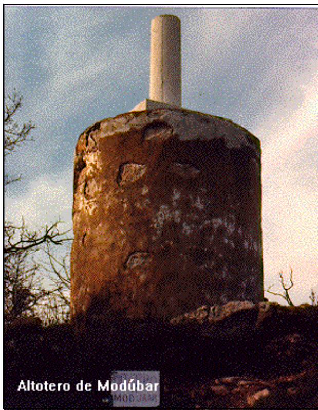
Altotero de Modúbar

Desde Modúbar de la Emparedada, por la carretera a Burgos por Cardeñadizo, recorrido 1,5 Km., al llegar al collado (Km. 2,300), se entra a la derecha por un camino de concentración parcelaria, que en 400 m. deja a unos 10 m. de la señal.