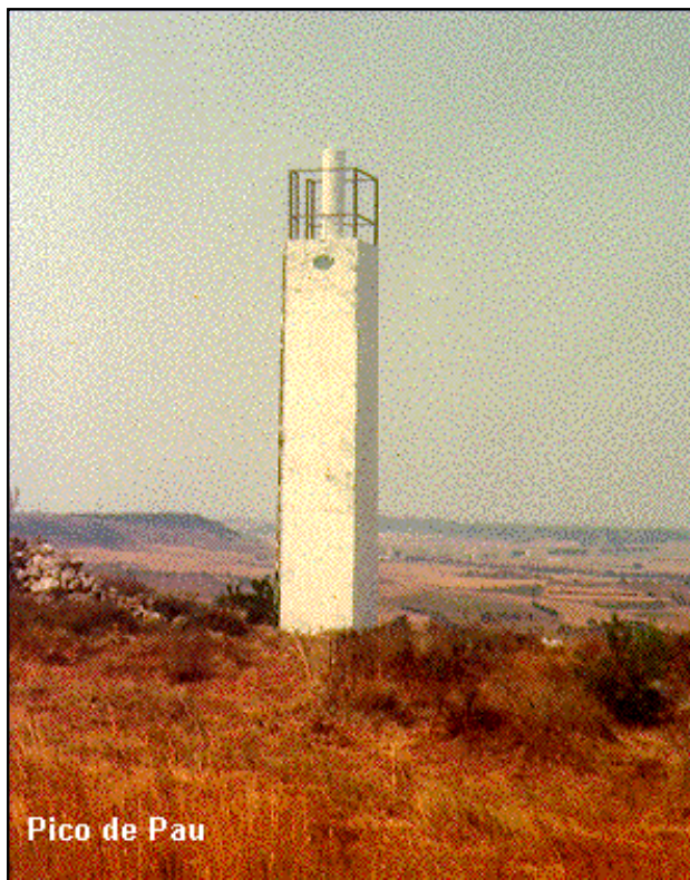
Pico de Pau

Saliendo de Astudillo, cojemos la carretera que va a Castrojeriz, pasamos el K.33 y a 600 m. de éste cojemos un camino que sale a la dcha, despues de 1800 m de recorrido llegamos a un cruce, en lo alto del páramo, dejando el coche en éste punto y atravesamos andando una tierra de labor en dirección S. por el borde de un pinar, y en 10 minutos se llega al vértice.