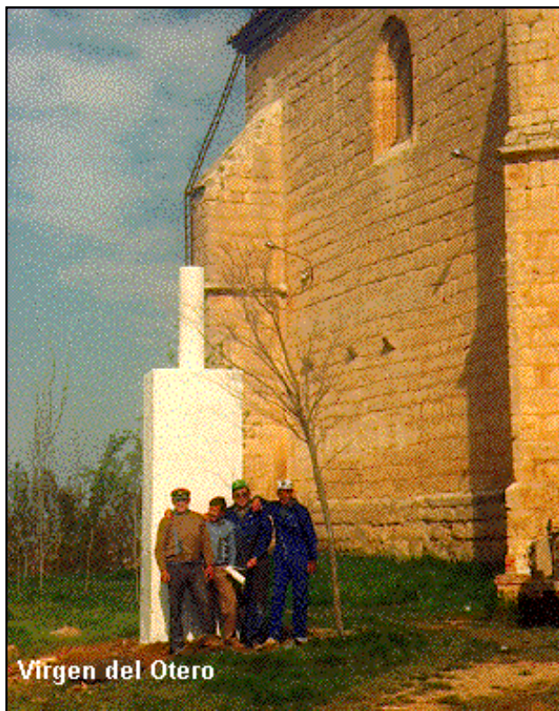
Virgen del Otero

Arbolado muy próximo al vértice y ermita.