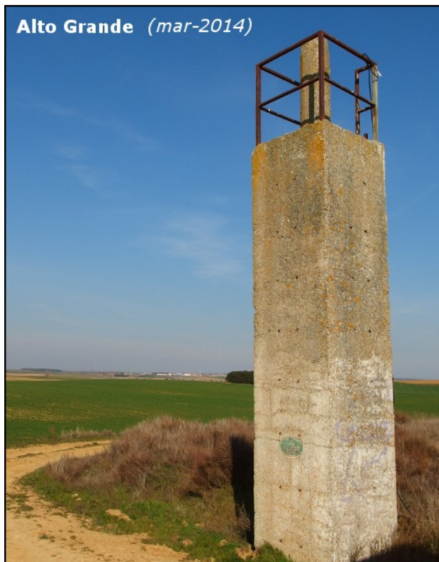
Alto Grande (mar-2014)