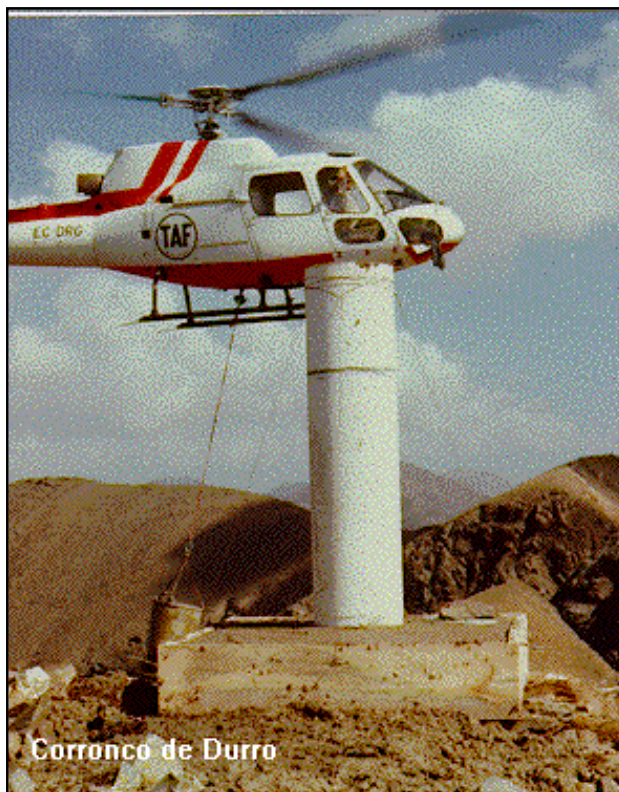
Corronco de Durro