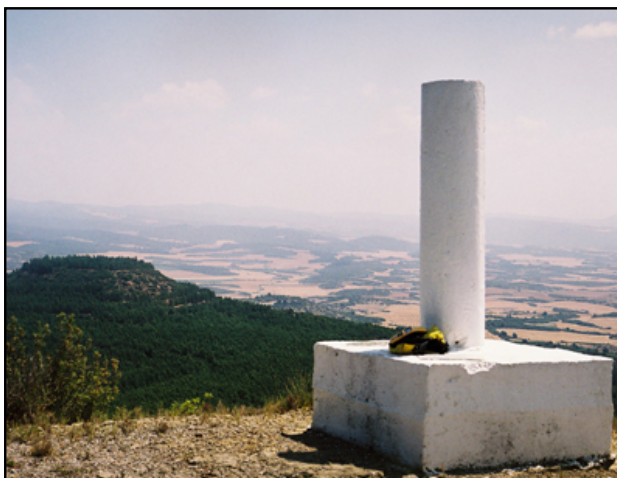
Pinar de Caseda