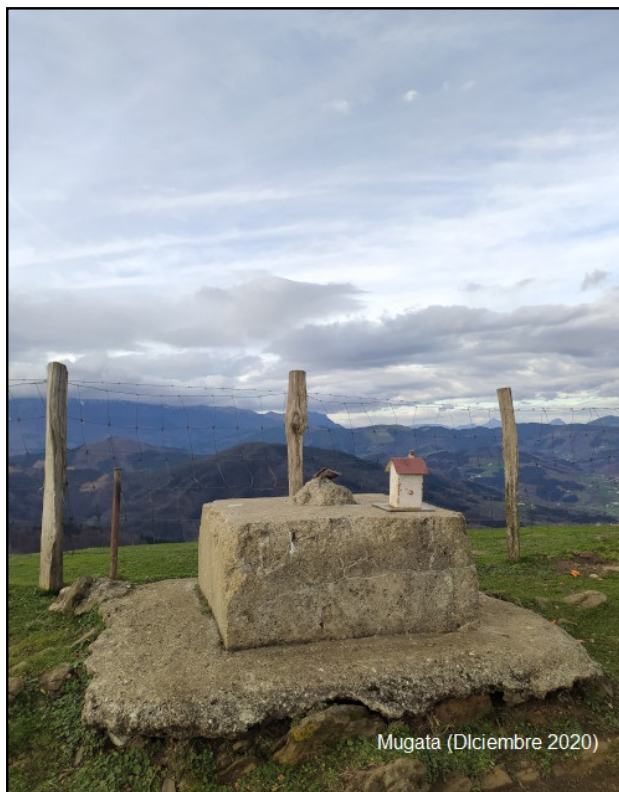
Mugata (Diciembre 2020)