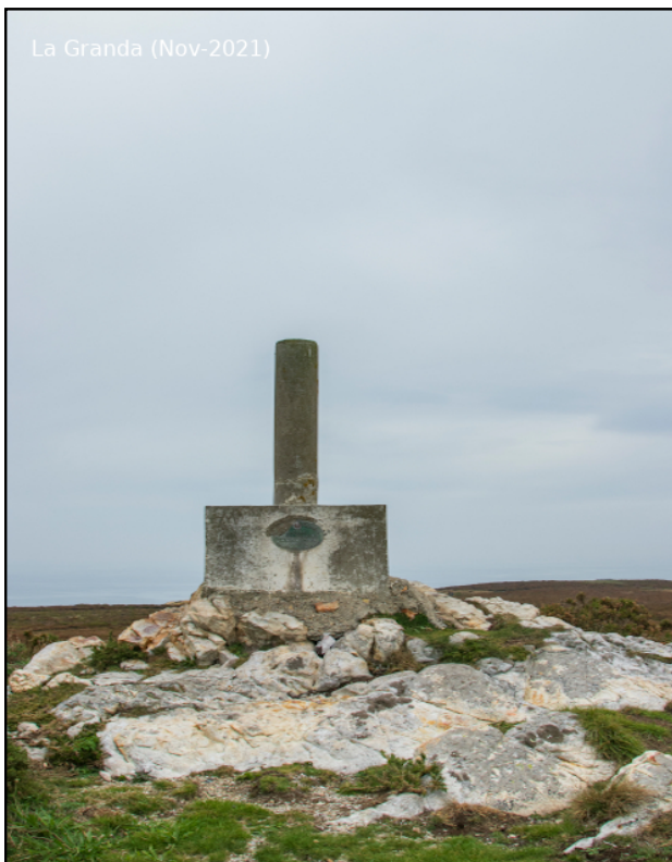
La Granda (Nov-2021)