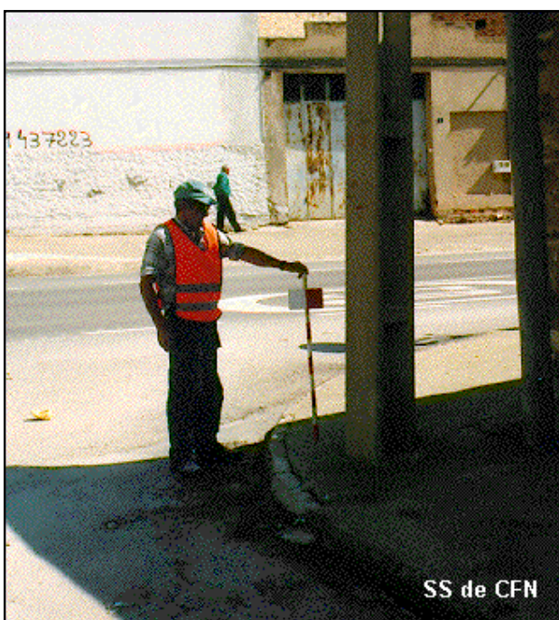
SS de CFN

Anterior: 20206170 - SS6.300 Posterior: 20206172 - NGW693 Agrupada con: