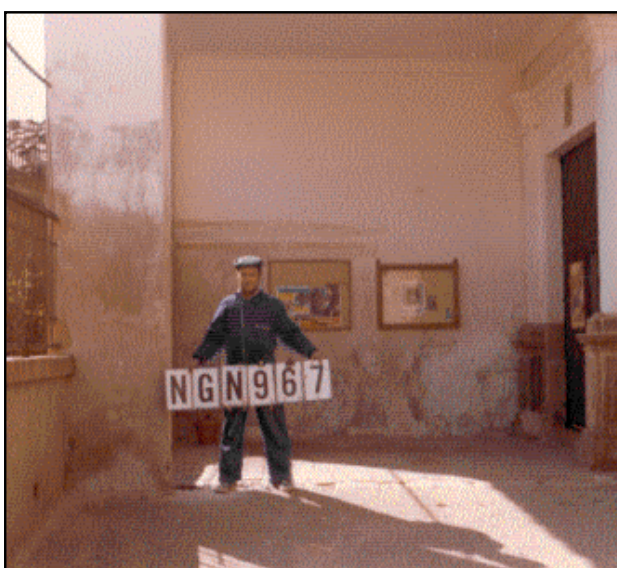
- Fin Ramal 1255 a la Iglesia de Villastar NGN967

Clavo metálico con la inscripción NGN 967 incrustado en la población de VILLASTAR sobre el pavimento hormigonado existente junto a un pilar de un pequeño porche, a la entrada principal de la Iglesia, según croquis.