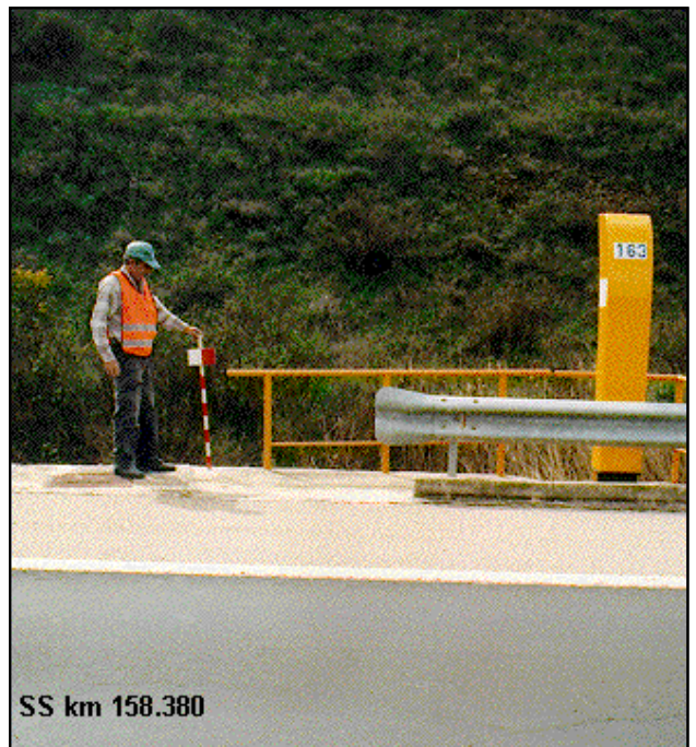
SS km 158.380

Anterior: 10206050 - NGT488 Posterior: 10206052 - NGT489 Agrupada con: